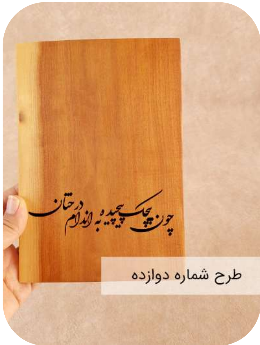
طرح شماره دوازده