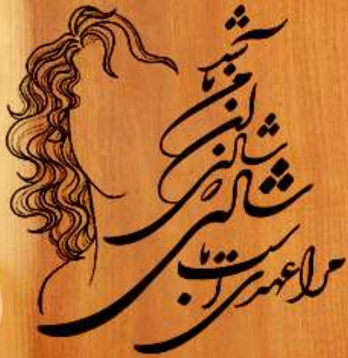
طرح شماره چهارده غیر قابل مشابه سازی