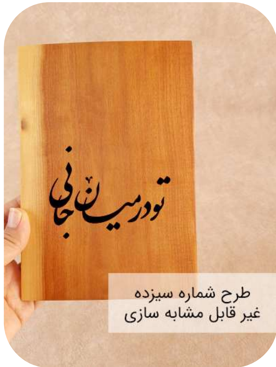
طرح شماره سیزده غیر قابل مشابه سازی