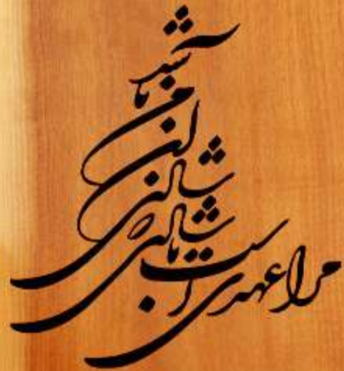
طرح شماره شانزده غیر قابل مشابه سازی